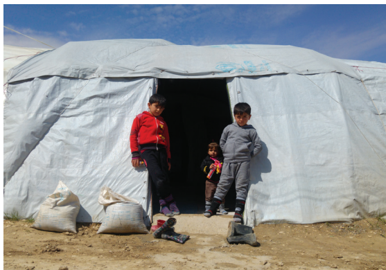
Irak

chorôb a s príchodom leta, kedy teploty dosahujú až 50°C, znamenal deficit vody aj ohrozenie života. Slovenská katolícka charita sa preto rozhodla obnoviť zničené studne, a tak priniesť pitnú vodu ľuďom v núdzi. Obnovila vrty, kúpila generátory, čerpadlá a postavila nad nimi prístrešok, ktorý zaručí ich ochranu a dlhodobé fungovanie. ■