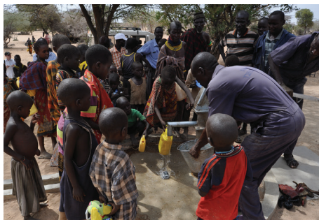
Keňa

JUŽNÝ SUDÁN. Ako sa starať o pôdu, diverzifikovať plodiny, uskladniť semená či používať nízkonákladové zavlažovacie techniky? Takéto tréningy pre chudobné rodiny robil Človek v ohrození na severozápade Južného Sudánu v oblasti Aweil. ■