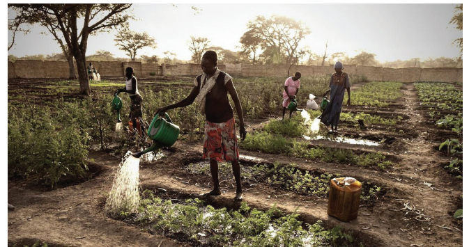
Južný Sudán

KEŇA. Ak na mieste rastú, zabráňujú pôdnej erózii a poskytujú útočisko morským živočíchom. Ak ich vyrúbu, často to vedie k povodňam, rybníky splynú s oceánmi a rodina príde o prísun jedla. Ochrane mangrovníkov na pobreží Kene sa Človek v ohrození venuje už od roku 2012. Za štyri roky vysadili viac ako 200-tisíc mangrovníkových stromov a pomohli tak tisícom rybárov získať znova zdroj obživy.