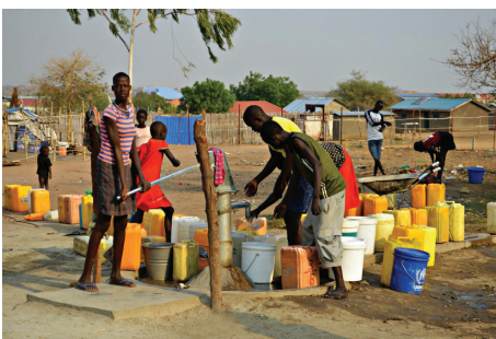
Južný Sudán

Vďaka verejnej zbierke Tehlička mohlo SAVIO postaviť studňu pre nemocnicu v Južnom Sudáne. SAVIO tiež vyhlúbilo a prevádzkuje studne v centre pre deti z ulice Bosco Boys v Nairobi, Keňa a pre školu v N'Djamena, Čad. V Ekvádore prispelo na vybudovanie hygienických zariadení v Tuuti Entsa.